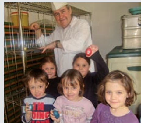
Foto: Eiersuche im Montessori-Kindergarten