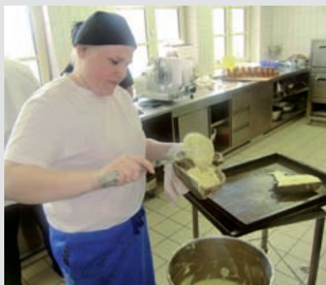
Befüllen der Backformen

Auch die Kinder des Montessori-Kindergartens durften sich zu Ostern freuen: Viel Spaß hatten sie bei der Ostereiersuche im Keller des Alten- u. Pflegezentrums, das Küchenpersonal hatte dabei einige besonders gute Verstecke ausgesucht.