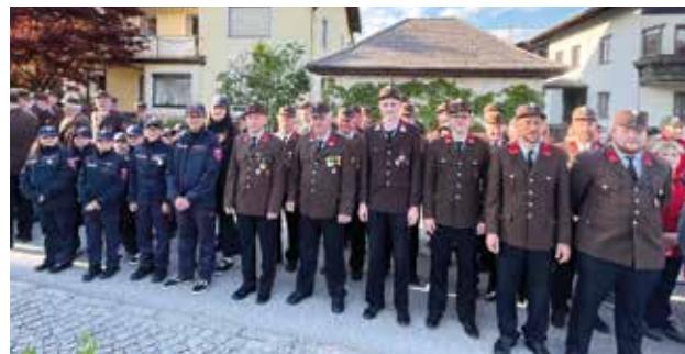
Unsere Feuerwehren bei der letztjährigen Florianifeier.