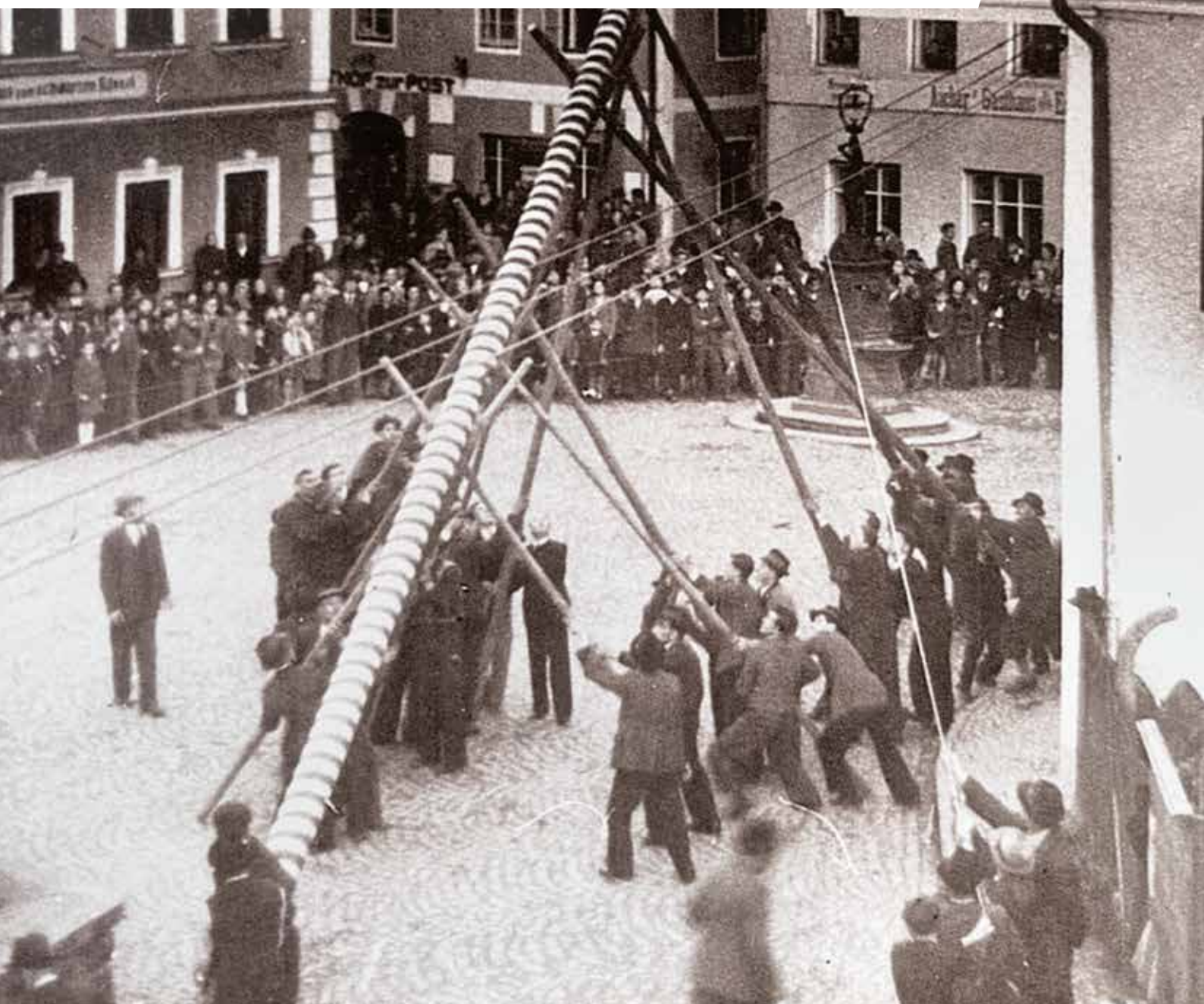
Maibaum-Aufstellen am Marktplatz 1952

Offizielles Mitteilungsblatt der Marktgemeinde Vöcklamarkt