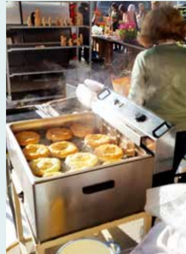
Die frischen Bauernkrapfen unserer Ortsbäuerinnen – immer ein Anziehungspunkt.